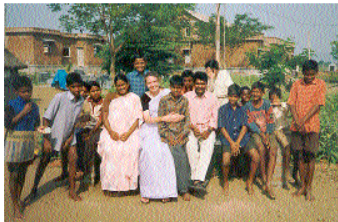
Jolette in Chiguru. Op de achtergrond de nieuwe gebouwen

En nu is daar Chiguru, vrij vertaald vanuit het Telugu betekent dat Jonge Scheut. Een prachtige plek midden tussen de bananenplantages en langs de Krishna rivier, net buiten Vijayawada gelegen. Een kinderdorp waar al 80 jongens wonen en waar hard gebouwd wordt om eind augustus dit jaar de nieuwe gebouwen in te wijden. De Chiguru-familie!